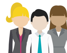
EQUIPO TÉCNICO DEL PROGRAMA DE SANCIONES PENALES JUVENILES