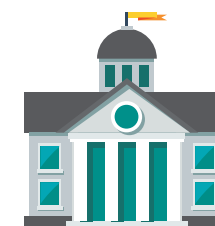
JUZGADO DE EJECUCIÓN DE LAS SANCIONES PENALES JUVENILES